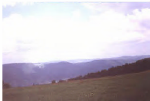
althaeusle1.jpg Fehler! Textmarke nicht definiert. althaeusle1.jpg

Der Hof von Süden her gesehen. Hinten rechts das Simonswälder Tal